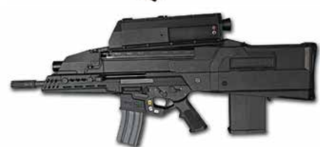
OICW (Objective Individual Combat Weapon) bestehend aus Sturmgewehr, Granatabschussgerät (20 mm) und Feuerleitanlage