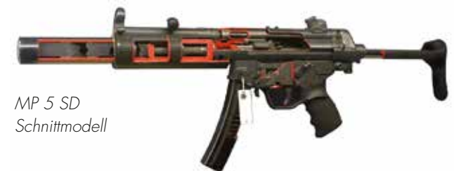
MP 5 SD Schnittmodell