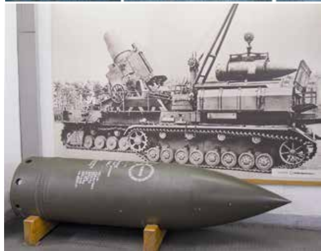
Panzer-Sprenggranate des 60 cm Mörsers »Karl«