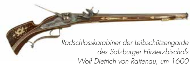
Radschlosskarabiner der Leibschützengarde des Salzburger Fürsterzbischofs Wolf Dietrich von Raitenau, um 1600

Derzeit verfügt die WTS über eine Gesamtzahl von etwa 9.000 Handfeuerwaffen, von denen etwa 500 Exponate zu sehen sind. Sie ist eine der bedeutendsten Sammlungen in Europa und zeigt die Entwicklung der Handfeuerwaffen vom Handrohr (Tannenbergbüchse) bis zum ultramodernen Versuchsmodell der OICW (Objective Individual Combat Weapon).