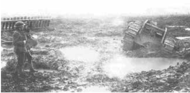
Bild 04: Neben mechanischen Schäden und Treffern von Artilleriekanonen war das Steckenbleiben in dem vom wochenlangen Artilleriefeuer verwüsteten Gelände an der Westfront eine der häufigsten Ausfallursachen der Tanks.

Erkenntnis: Vor einem Tankeinsatz war eine sorgfältige Geländeerkundung erforderlich!