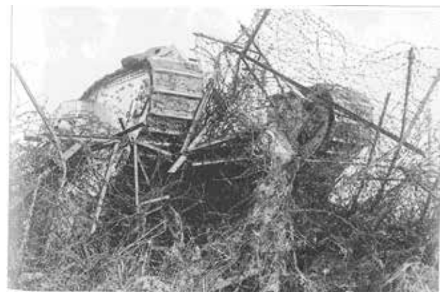
Bild 03: Britischer Tank bei der Überwindung eines Stacheldrahthindernisses. Ein kleiner Teil der Fahrzeuge war mit speziellen Schneidwerkzeugen (wire-cutter) ausgerüstet. Nach Niederkämpfen der MG-Nester und Niederwalzen der Stacheldrahthindernisse haben die Tanks den Weg für die Begleitinfanterie geebnet.