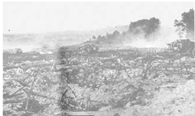
Bild 02: Szene eines Tankangriffs an der Westfront. Begleitinfanterie ist auf dieser Aufnahme nicht erkennbar.

ablegen. Die Tanks der zweiten Welle (mit begleitender Infanterie) sollten entlang an den Schützengräben fahren und dort den Gegner vertreiben, bzw. vernichten. Die Ausweitung des Einbruchs in die feindlichen Linien zu einem Durchbruch, bzw. Stoß in die Tiefe war ursprünglich nicht vorgesehen.